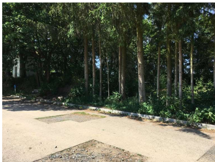
Pohled z komunikace 1542 na požadovaný pozemek – mimo stávající kapličky – spodní část pozemku 1091.