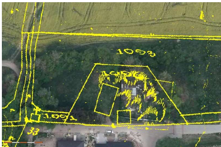
Náhled na požadovaný pozemek s leteckým snímkem.