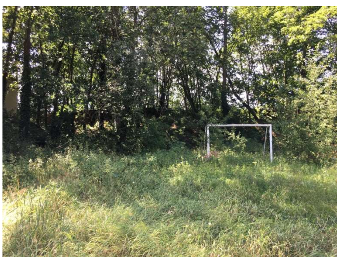
Pohled na požadovaný pozemek. Jedná se o stráž – v mapě označeno červeně - levá část.